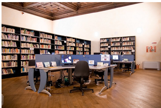
Sala lettura della Mediateca

L'inizio del nuovo anno ha portato una novità anche agli archivi della Mediateca Regionale Toscana che sono sempre più ricchi perchè composti da 8.000 film d'autore, 3000 documentari , 8.000 titoli di testi e saggi sul cinema e sulla televisione; ma anche 350 titoli di periodici specializzati, 5.000 foto e manifesti di film e ricchi fondi monografici tra cui "Pier Paolo Pasolini" e "Pio Baldelli".