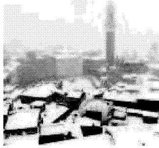
Siena la provincia più colpita

Altro che trasporti, la Toscana è in ginocchio a causa della mancanza di elettricità. La rete è andata in tilt e ieri alle 10 c'erano ancora 8.096 persone da riallacciare nelle province di Livorno, Arezzo e Siena. L'Isola di Gorgona, dove c'è un penitenziario, è rimasta al buio e al freddo per un'intera giornata dopo che un albero,