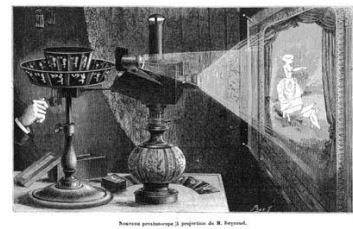
Prassinoscopio da proiezione

Come riesce, dunque, il mago di Oz a sconfiggere le streghe cattive?