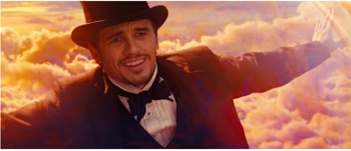
(Oscar Diggs, il mago di Oz)