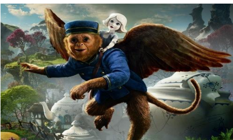
(Finley e la Bambina di Porcellana)