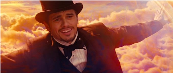
(Oscar Diggs, il mago di Oz)