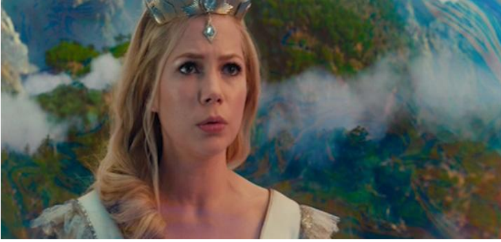
(Glinda, la strega buona)

Che cosa è accaduto poco prima della sequenza dell'Unità 3?