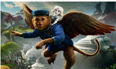
(Finley e la Bambina di Porcellana)