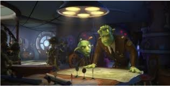
Il generale Grawl: