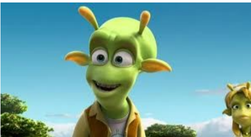
Il generale Grawl